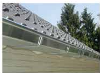
LOOD- EN ZINKWERKEN