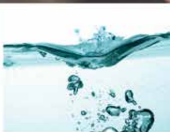
GAS - WATER