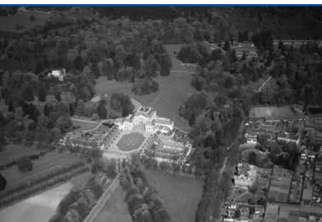
Luchtfoto van de omgeving van Paleis Het Loo, circa 1930.