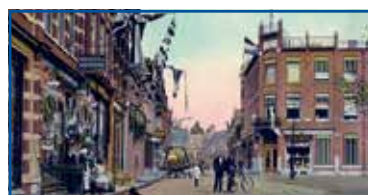
Hoofdstraat ter hoogte van het Raadhuisplein, circa 1910.

In de gemeente Apeldoorn is de Stichting Erfgoedplatform Apeldoorn (EPA) de verbindende schakel tussen zeventien Apeldoornse erfgoedorganisaties. Iedere organisatie is op een specifiek erfgoedonderdeel actief met het levend houden en promoten van de Apeldoornse cultuurhistorie en bouwkunst voor hun eigen leden en andere belangstellenden. De stichting EPA organiseert, steunt en brengt organisaties en activiteiten samen, zoals het Historisch Café, de Open Monumenten Dagen, exposities, lezingen en wandel- en fietsroutes langs het erfgoed in de gemeente.